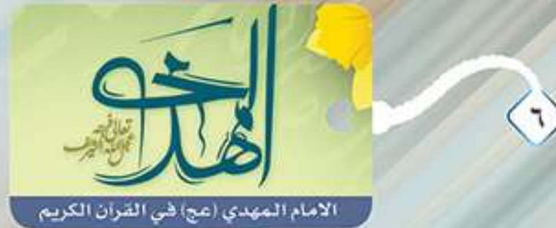
الامام المهدي (عج) في القرآن الكريم