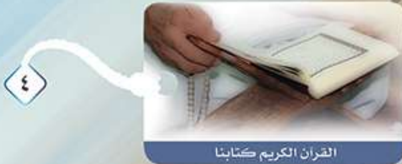
القرآن الكريم كتابنا