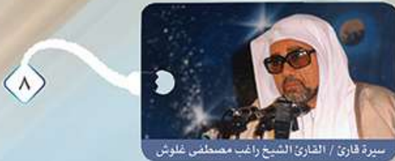
سيرة قارئ / القارئ الشيخ راغب مصطفى غلوش